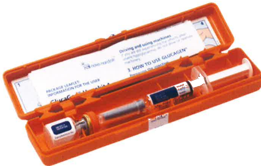
2 pav. GlucaGen® HypoKit

2 pav. yra pavaizduotas GlucaGen® HypoKit rinkinys, kurį sudaro buteliukas su liofilizuotu (šaltyje išdžiovintu) gliukagonu (1 mg), supakuotas kartu su naudoti paruoštu užpildytu švirkštu su SIV.